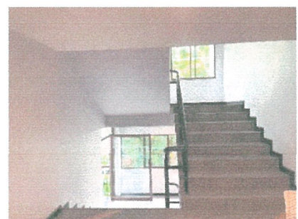
รูปภาพที่ 1.3 การใช้พื้นที่ของโครงการ