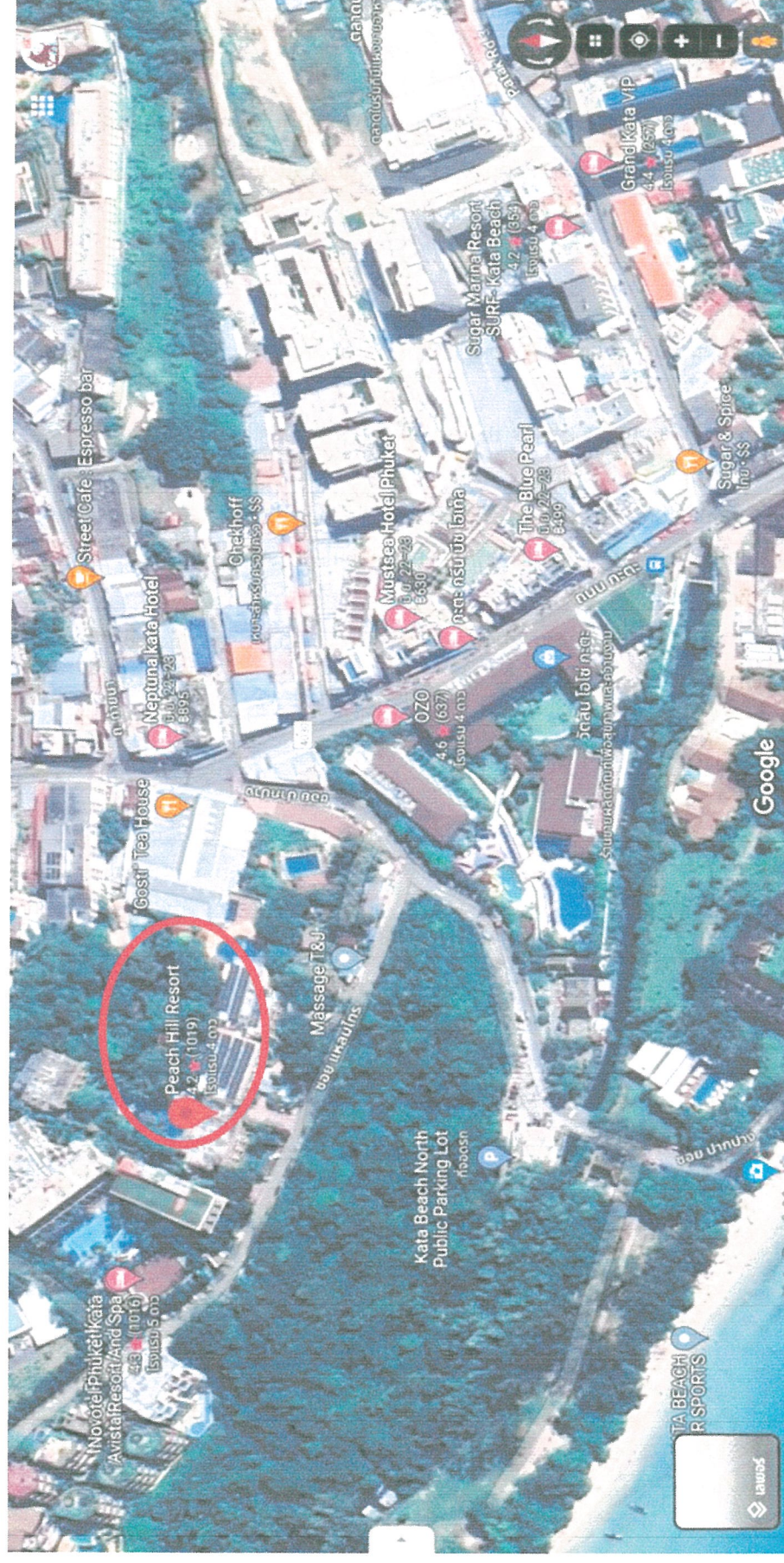
รูปภาพที่ 1.1 แผนที่ตั้งของโครงการ โรงแรม ฟิชเชิลส์ ภูเก็ต (Top view)

รายงานผลการปฏิบัติงานมาตรการป้องกันและแก้ไขผลกระทบสิ่งแวดล้อมและมาตรการติดตามตรวจสอบคุณภาพสิ่งแวดล้อม โครงการ โรงแรม ฟิชเชิลส์ ภูเก็ต ระยะดำเนินการ ระหว่างเดือน กรกฎาคม - ธันวาคม 2566